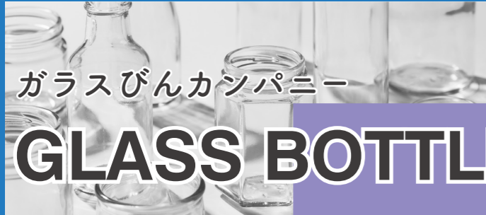
ガラスびんカンパニー

高速ラインによる安定生産と確かな品質で、 年間30億個以上の飲料キャップを生産。 プラスチックごみ問題を解決するために、 キャップリサイクリングシステム構築にも 力を入れています。