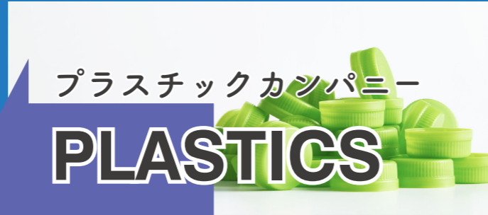
プラスチックカンパニー